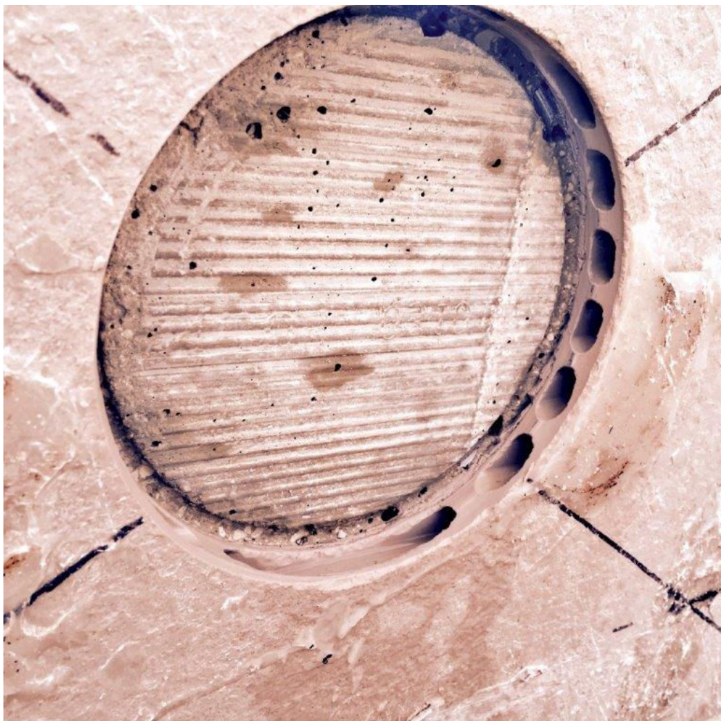
אריח פורצלן ללא שכבת בידוד בגב האריח (קיר-אמיר אריח בגוון חום)