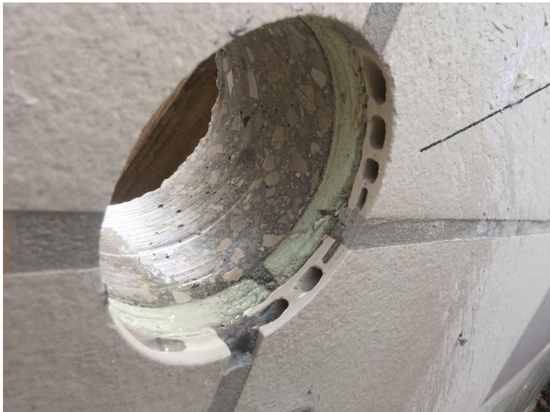
חתך קיר-אמיר עם שכבת בידוד בגב האריח (אריח בגוון לבן)